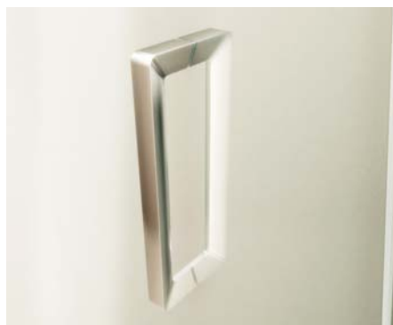
Detalle del tirador.