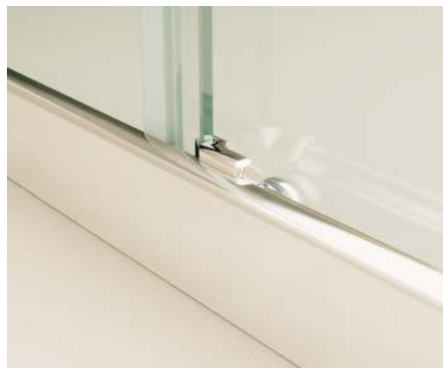
Detalle cruce hojas.