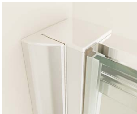
Detalle cierre hoja.