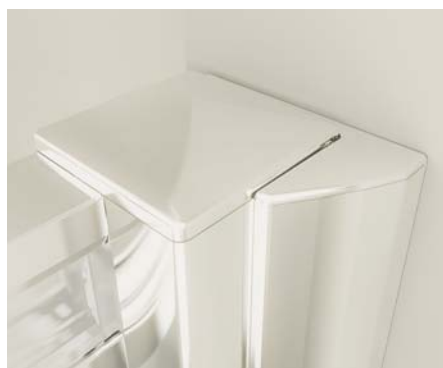
Detalle de la doble tapa superior.